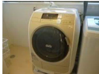
初度調弁備品、洗濯機